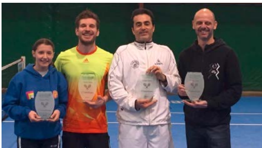
La Serbia Squadra vincente 2015